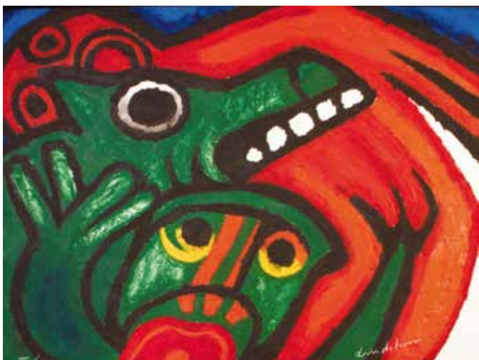
« Diomède »